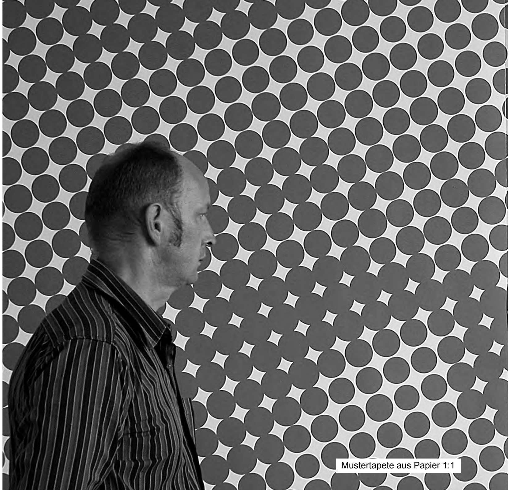
Mustertapete aus Papier 1:1