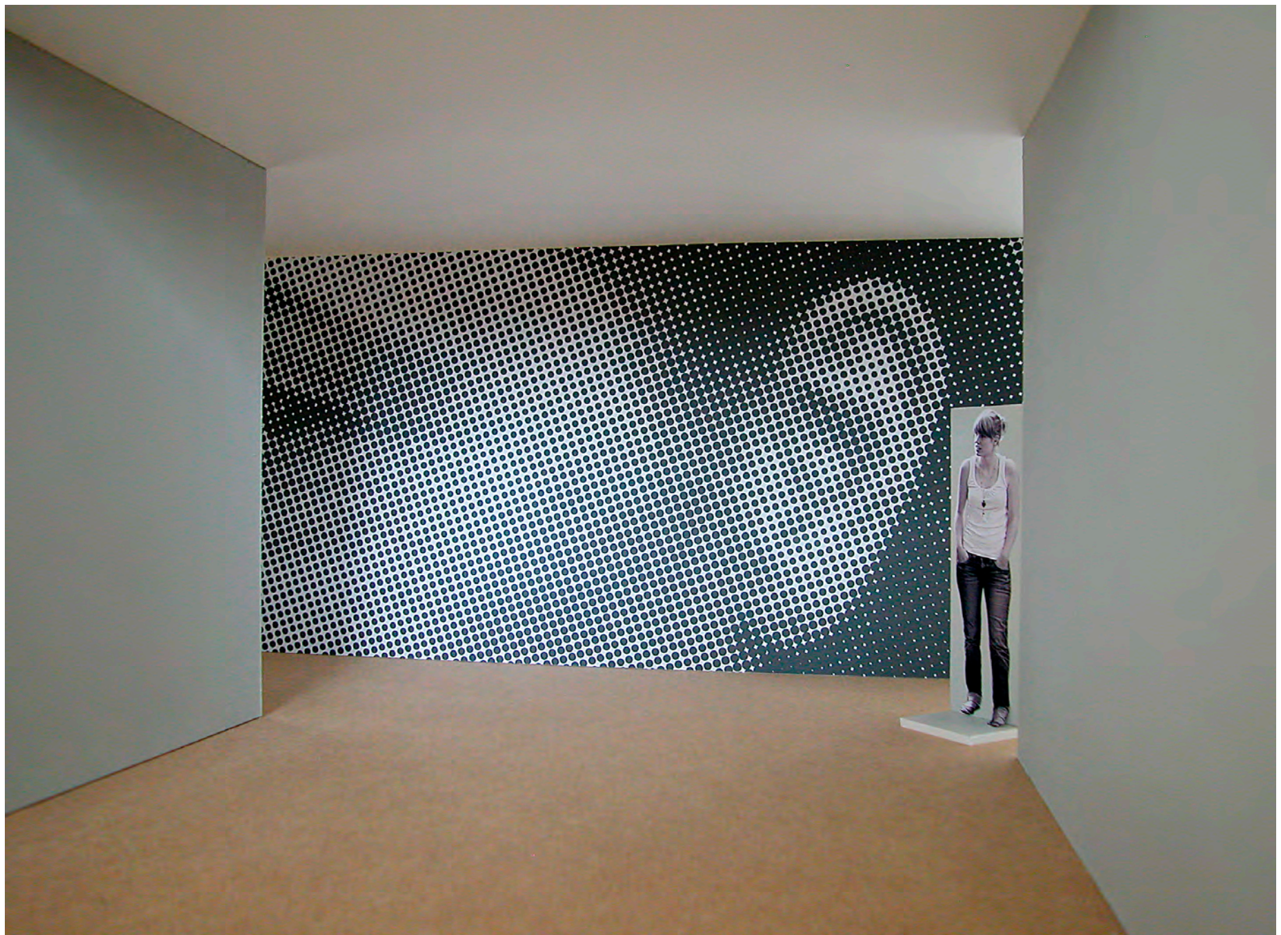
EINGANGSBEREICH Modellfoto „Ecouitevoir“ Wandmaße: 7,60 m x 3,00 m Modell 1:10